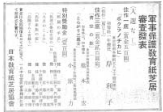
図 2 軍事保護紙芝居の審査結果広告

る国民教化のために行われた「軍事保護教育紙芝居懸賞募集」(図 2) の入賞作品に感想を寄せたものである。懸賞募集は、軍事保護院、軍人援護会の後援により、日本教育紙芝居協会が主催したもので、『教育紙芝居』(後に『紙芝居』と改題) の 1941 (昭和 16) 年 7 月号と、『週刊朝日』同年 6 月 24 日号の誌上で募集が告知された 22) 。倉橋が、具体的な戦争協力を行っていたという重要な事実でもある。