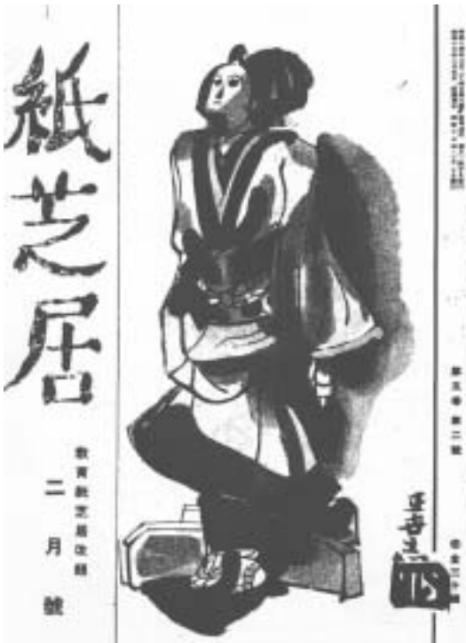
図1 『紙芝居』昭和17年2月号の表紙(1942)

「日本少国民文化協会」は、日本の軍国主義が強まり戦時下の児童文化を統制しようとする動きの中で、1941(昭和16)年に創立された。会の定款によれば、「本会ハ皇国ノ道ニ則リ国民文化ノ基礎タル日本少国民文化ヲ確立シ以テ皇国民ノ練成ニ資スルヲ目的トス」とうたわれている。専門部会として、文学・絵画・童話・遊具・紙芝居・演劇・映画・舞踊・音楽・蓄音機レコード、出版の11分野があり、最盛期には二千人の会員を擁するほどの大組織であったが、敗戦により1945(昭和20)年に解散している。